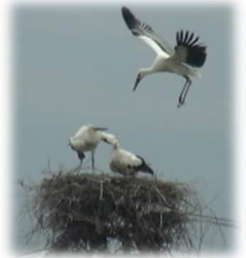
巣立ち期の3羽のひな