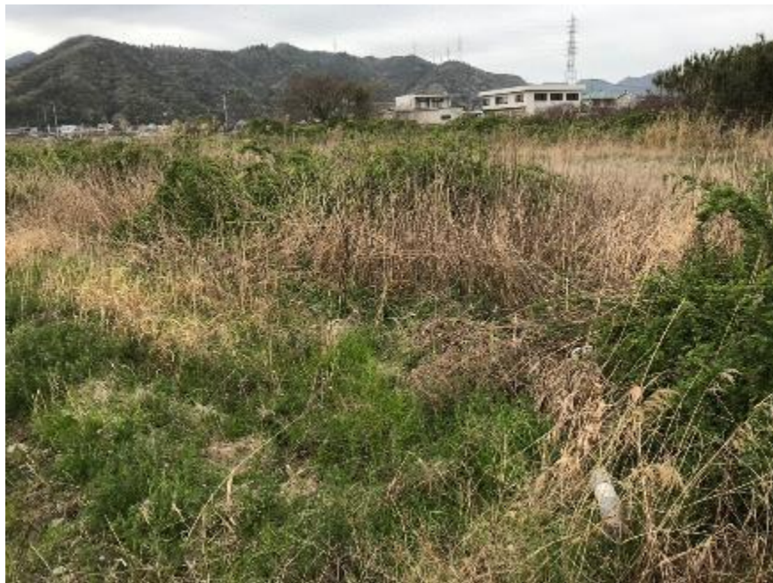
20年以上放置された元水田 グラウンドレベルが上がり陸地化 陸地の生態系