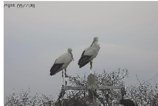
5年連続で繁殖している鳴門板東ペア