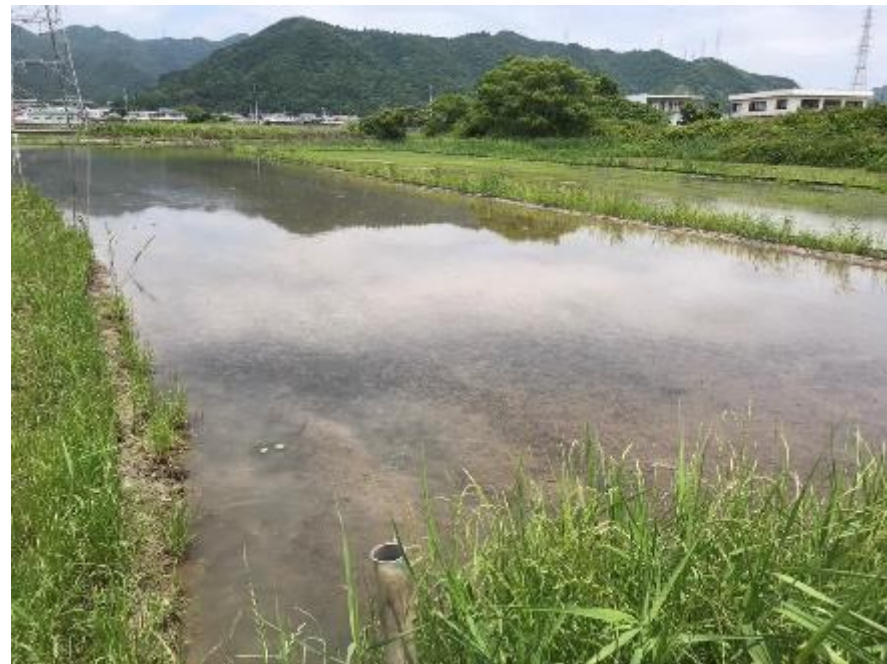
水田環境を再生したビオトープ 水を貯める機能が回復 水辺の生態系