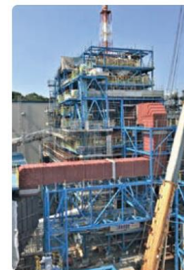
いわき大王製紙に設置した リサイクル発電設備

現在、大王製紙三島工場(愛媛県四国中央市)においても、同様の リサイクル発電設備2基を導入し、 石炭ボイラー1基を停止する計画 (2030年までを目標)を進めています。 これにより地域の廃棄物を資源として 有効活用し、化石由来の燃料を削減する ことで、地域全体での温室効果ガス削減 を進めていきたいと考えています。